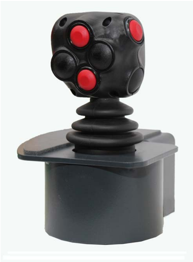
Stoll Joystick ErgoLine